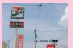
↑セブンとコジマの間 ↓ローソン前 二和西