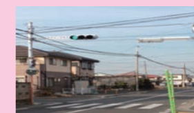
↑常圓寺先 二和東 ↓松が丘バス通り