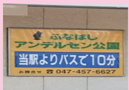
三咲駅構内の案内