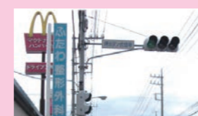
↑マクドナルド前 二和東 ↓御滝不動尊の角 二和西