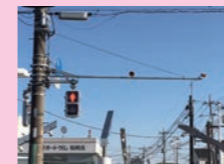
↑音響付き信号 三咲 ↓桜並木 二和西